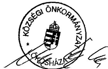
Szücsné Gergely Györgyi Lőkösháza Község Polgármestere